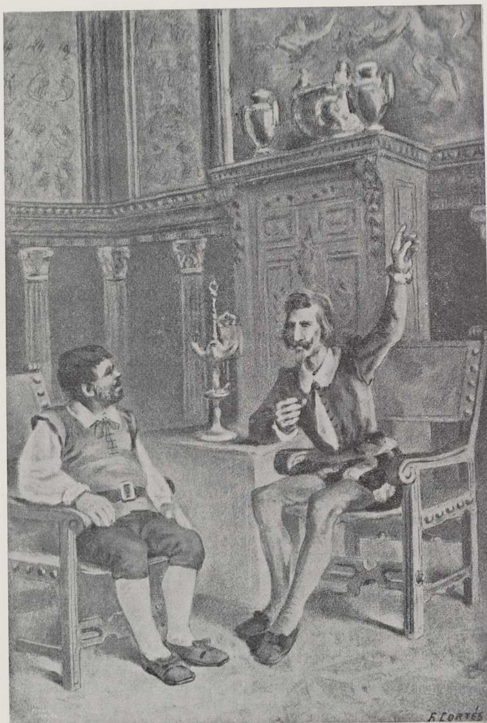
Deseño de F. CORTES