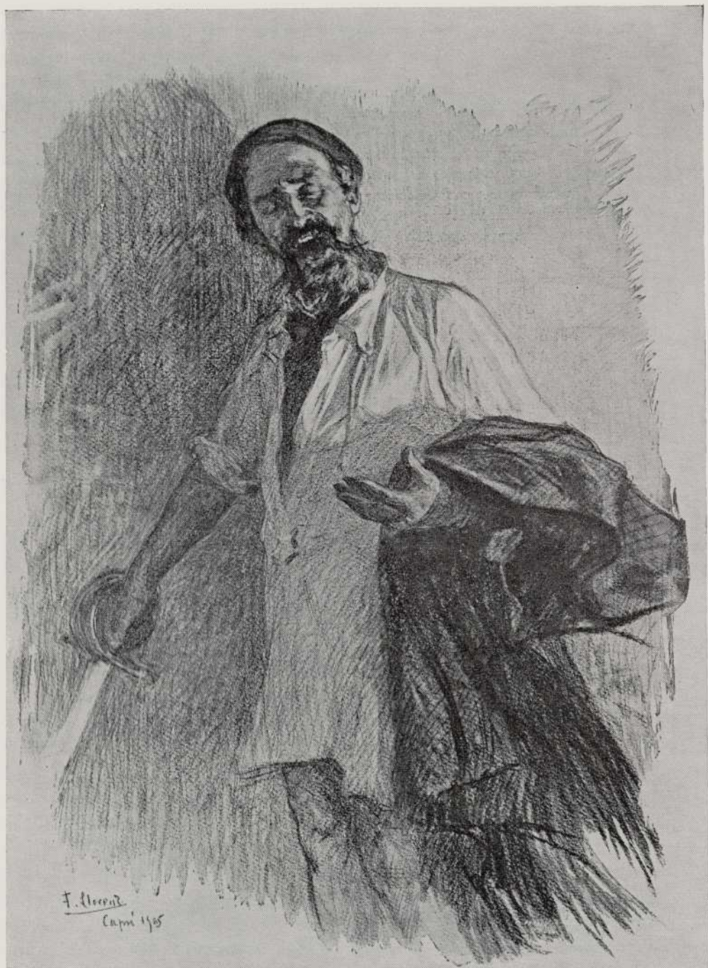
Deseño de F. LLORENS

Tente, ladroeiro, malvadoso, bandallo, que cá che teño... Estaba en camisa, a que non era tan comprida que por diante poideralle cubrir as coxas